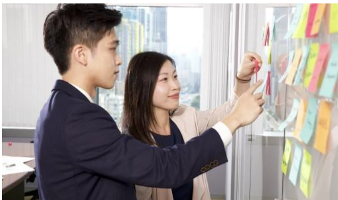
使用者體驗設計思維